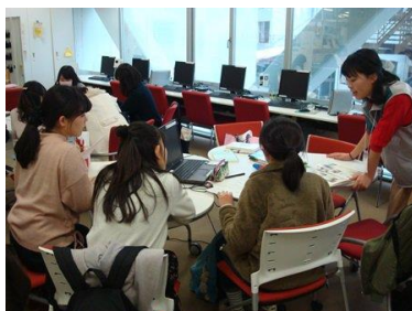
SAが細やかにサポート