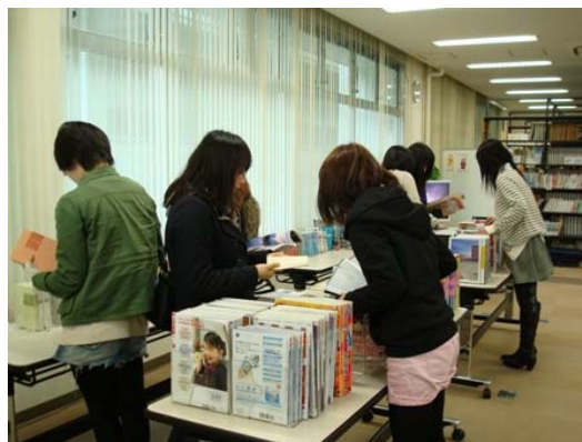
↑ 昨年の古本まつり

なお、引き取り手がなく残ってしまった場合は、図書館で処分もしくはご本人にお持ち帰りいただきますので、ご承知おきください。